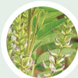
甘草 (グリチルリチン酸2K)